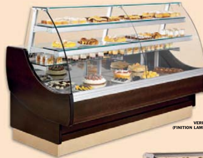
VERDI (FINITION LAMINÉ WENGÉ)