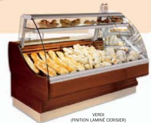
VERDI (FINITION LAMINÉ CERISIER)