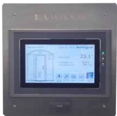
Taille l'écran de visualisation : l : 230mm, h : 180 mm Taille totale de l'écran et de sa plaque INOX : 250 x 250 mm Plaque d'encastrement 250 x 250 mm en INOX Boîte d'encastrement : 240 x 240 mm, prof. : 50mm Alimentation 230 V / 24 VCC par bloc d'alimentation secteur Câble de liaison 2,5 mètres

Les pictogrammes en mouvement permettent une compréhension immédiate de l'état du hammam (hammam ouvert ou fermé, production de vapeur, lumière allumée, ventilation...)